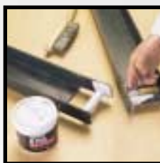
Loctite® 8153 aerosol Loctite® 8156 plechovka

Pasta proti zadření na bázi hliníku, pro šrouby, matice, trubky, výměníky tepla apod. Typické použití: spojení kola s nábojem.