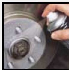
Loctite® 8150 Loctite® 8151 aerosol Loctite® 8060 stříbrná tyčinka

Pasta proti zadření na bázi mědi pro šrouby, matice, trubky, výměníky tepla apod. Typická použití: šrouby na výfukovém potrubí a na třmenech kotoučových brzd.