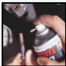
C5-A Loctite® 8007 aerosol Loctite® 8008 dóza se štětcem Loctite® 8065 tyčinka

Pasta proti zadření na bázi mědi pro šrouby, matice, trubky, výměníky tepla apod. Typická použití: šrouby na výfukovém potrubí a na třmenech kotoučových brzd.